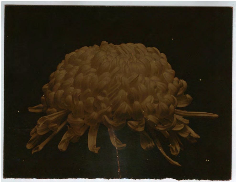
A Box of Ku #47