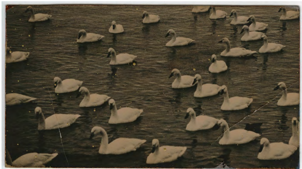
A Box of Ku #797