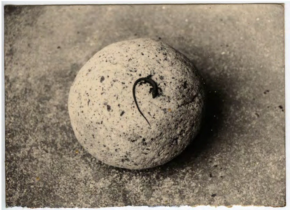
A Box of Ku #865