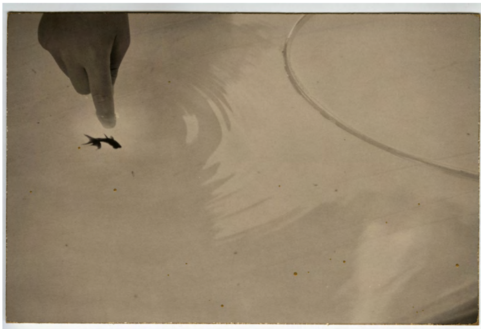
A Box of Ku #805