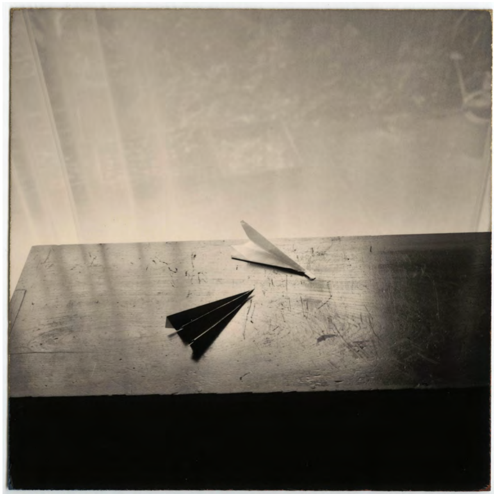
A Box of Ku #540