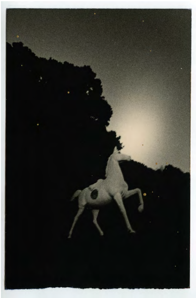
A Box of Ku #575